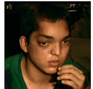
[Empty white box]